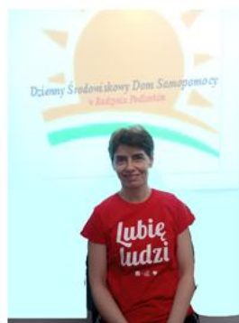
RED. ANNA K.