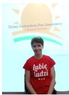
RED. ANNA K.