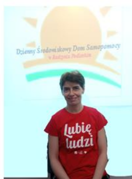
RED. ANNA K.